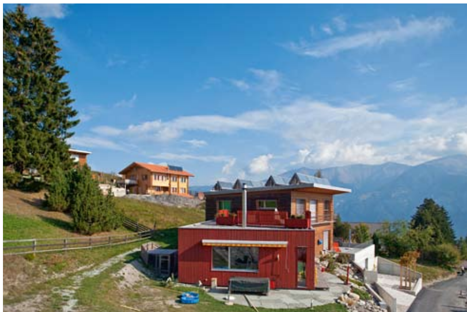
In einer dynamischen finanziellen Betrachtung sind Immobilien dann nachhaltig, wenn sie ceteris paribus mit langfristigen Entwicklungen wie steigenden Energiepreisen, demografischen Veränderungen oder Klimawandel gut umgehen können. Im Bild: Energiespar-Wohnzone in Flerden (GR).

Nachhaltigkeit ist heute in aller Munde. Der Trend hat auch die Immobilienbranche erfasst, die in der Schweiz einen eigentlichen Minergie-Boom erlebt. Staatlich wird Nachhaltigkeit gefordert (Aktionsplan Nachhaltige Entwicklung des Bundes) und teils gefördert, so etwa durch das nationale Gebäudeprogramm oder kantonale Fördergelder. Dabei wird implizit davon ausgegangen, dass sich Nachhaltigkeit langfristig auszahlt. Aber was ist überhaupt nachhaltiges Bauen und eine nachhaltige Immobilie? Zahlt sich Nachhaltigkeit tatsächlich finanziell aus? Und wie kann es in der Praxis gemessen und bewertet werden?